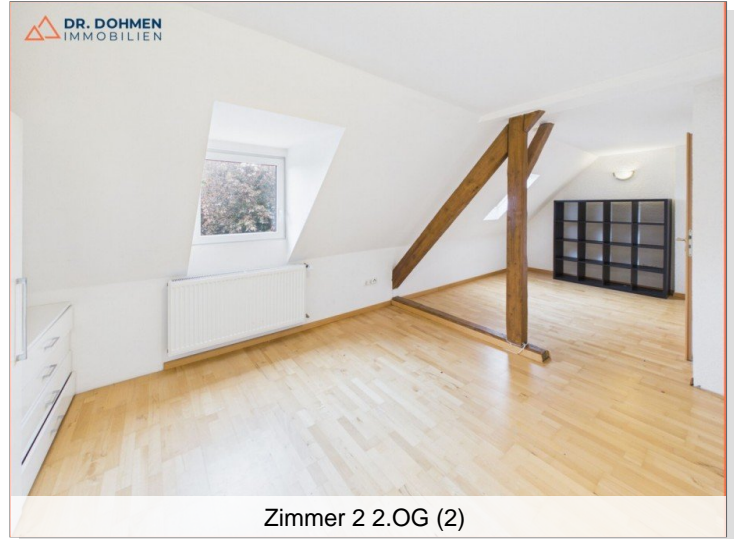
Zimmer 2 2.OG (2)