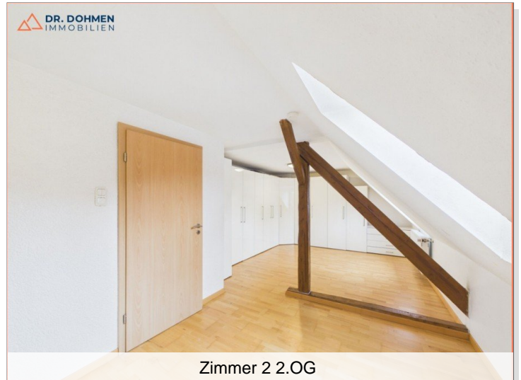
Zimmer 2 2.OG