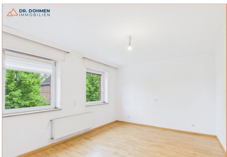
Zimmer 1 1.OG