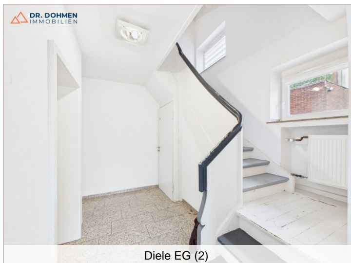
Diele EG (2)