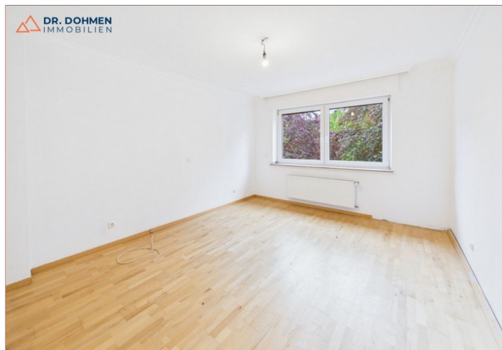
Zimmer 2 1.OG