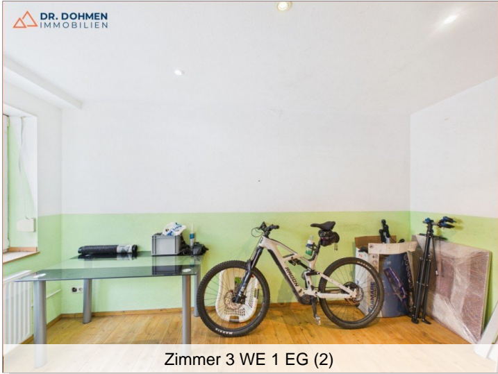
Zimmer 3 WE 1 EG (2)