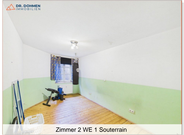
Zimmer 2 WE 1 Souterrain