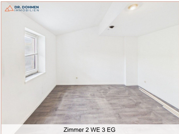
Zimmer 2 WE 3 EG