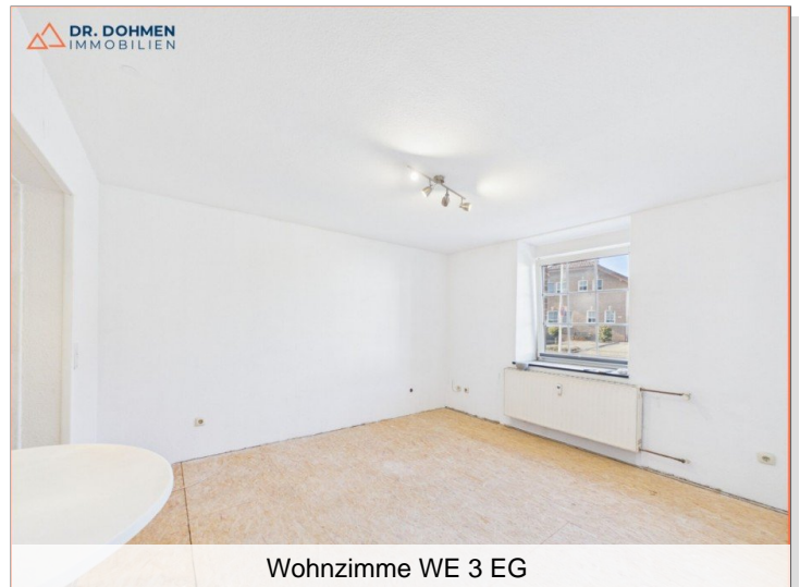
Wohnzimme WE 3 EG