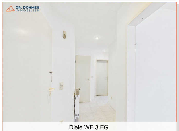
Diele WE 3 EG