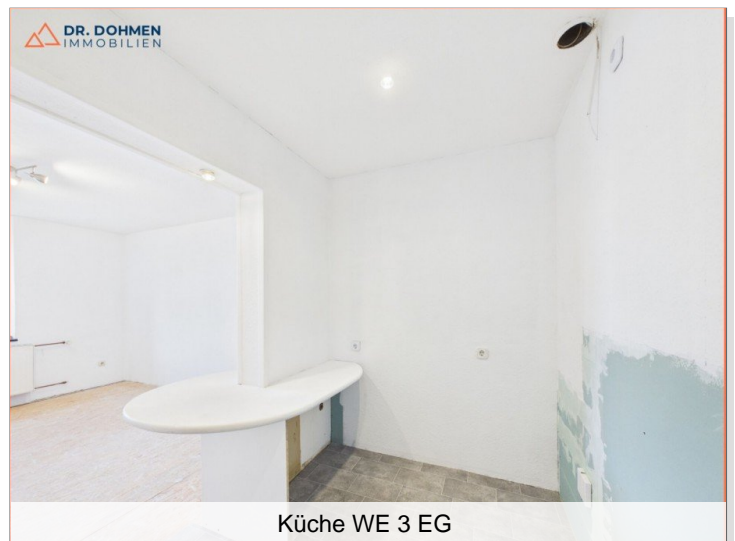
Küche WE 3 EG