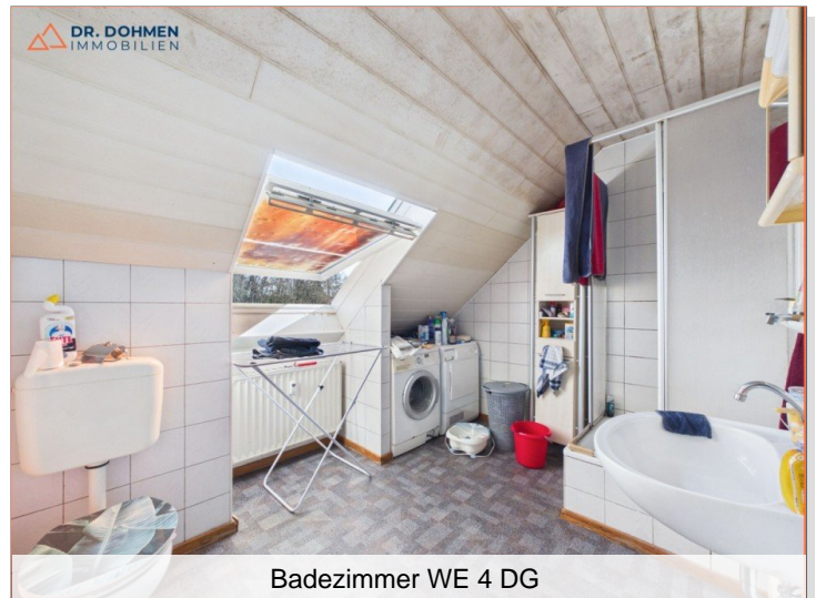
Badezimmer WE 4 DG