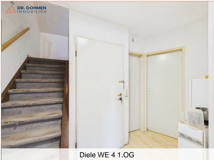
Diele WE 4 1.OG