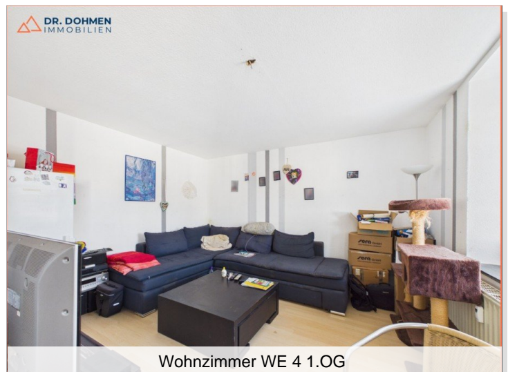
Wohnzimmer WE 4 1.OG