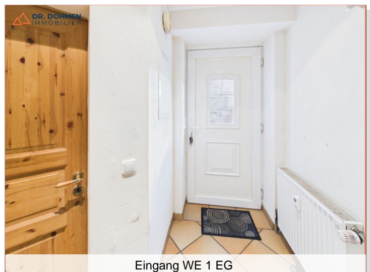
Eingang WE 1 EG