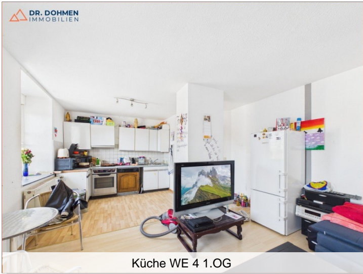
Küche WE 4 1.OG