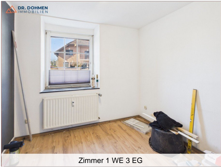
Zimmer 1 WE 3 EG