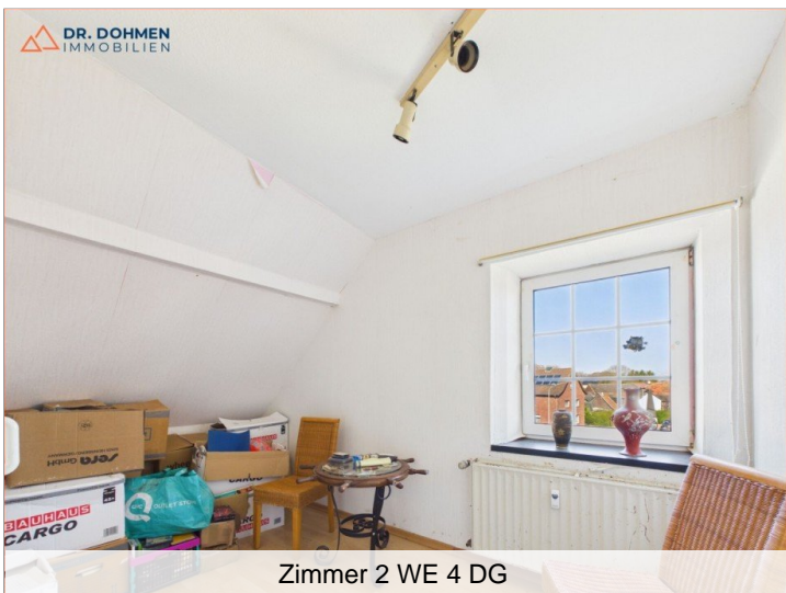
Zimmer 2 WE 4 DG