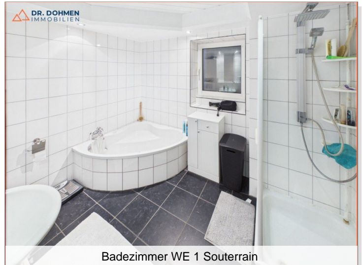
Badezimmer WE 1 Souterrain