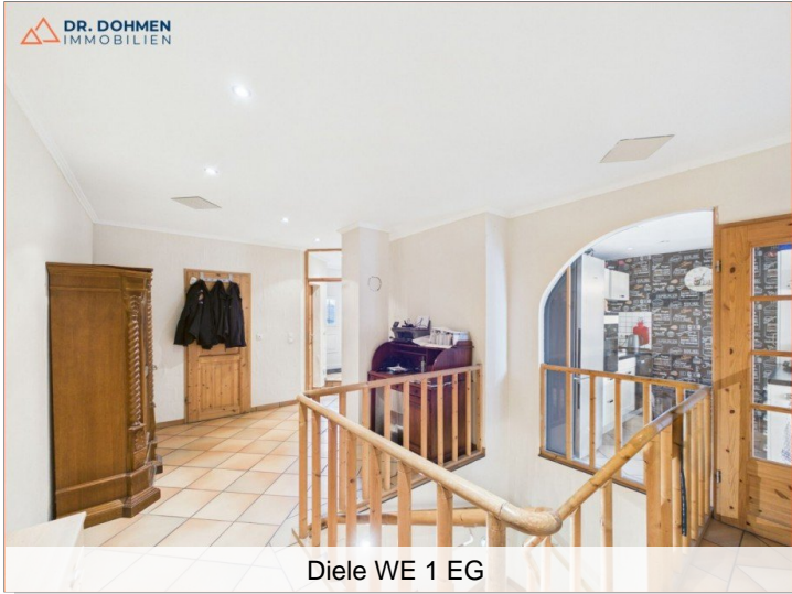
Diele WE 1 EG