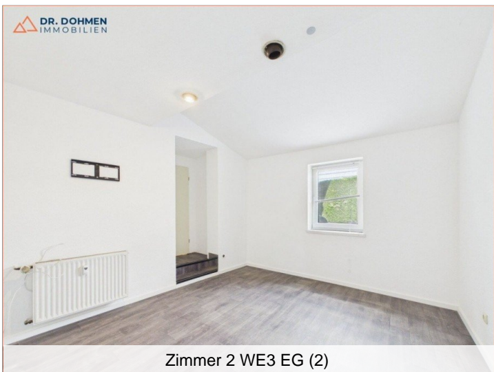
Zimmer 2 WE3 EG (2)