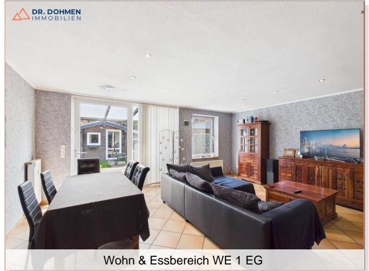
Wohn & Essbereich WE 1 EG