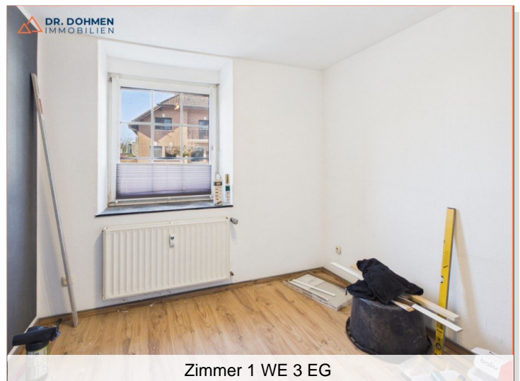
Zimmer 1 WE 3 EG