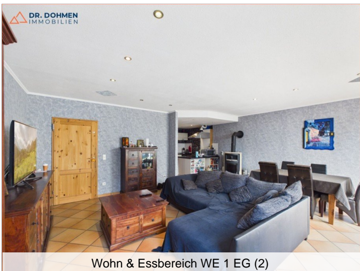
Wohn & Essbereich WE 1 EG (2)