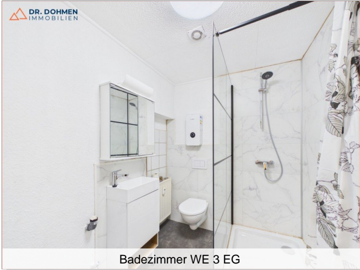
Badezimmer WE 3 EG