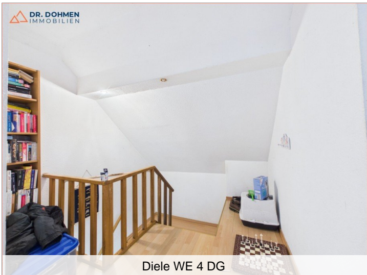
Diele WE 4 DG