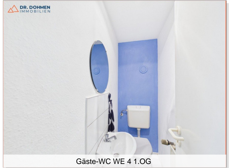
Gäste-WC WE 4 1.OG