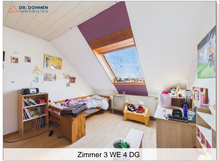
Zimmer 3 WE 4 DG