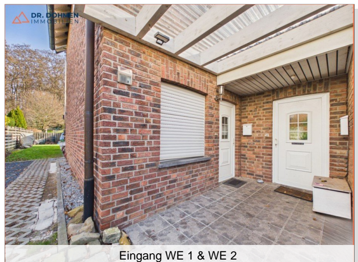
Eingang WE 1 & WE 2