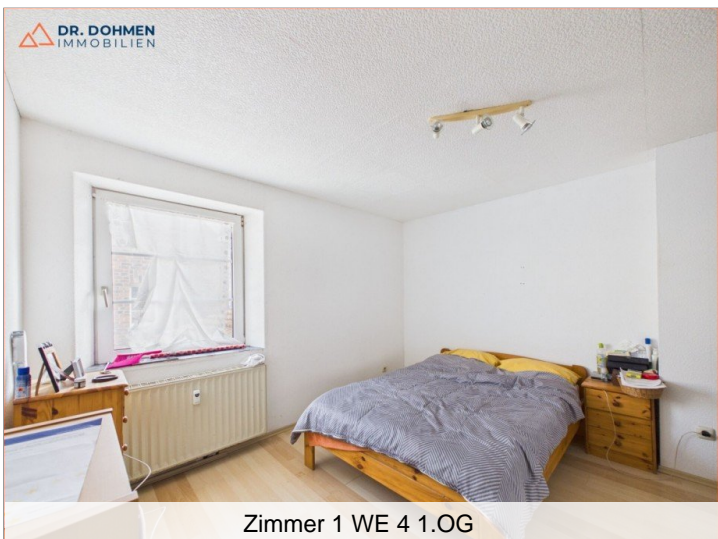
Zimmer 1 WE 4 1.OG