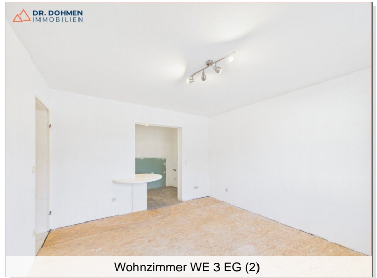
Wohnzimmer WE 3 EG (2)