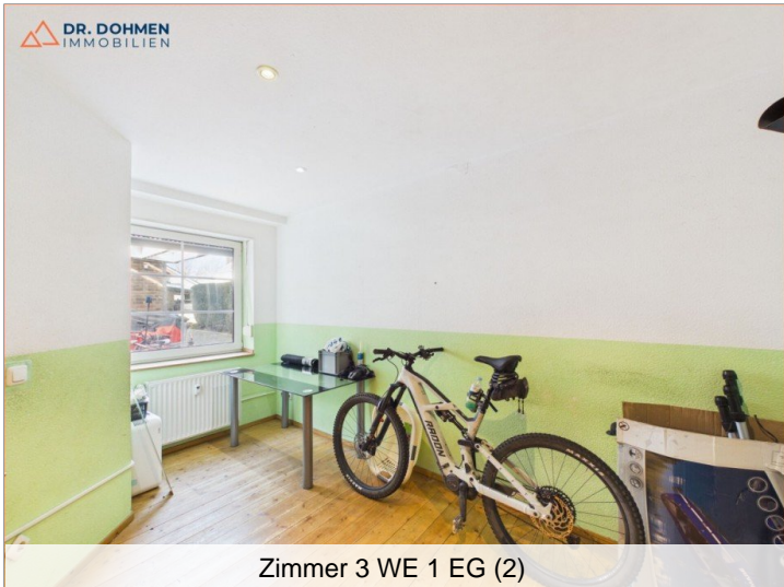
Zimmer 3 WE 1 EG (2)