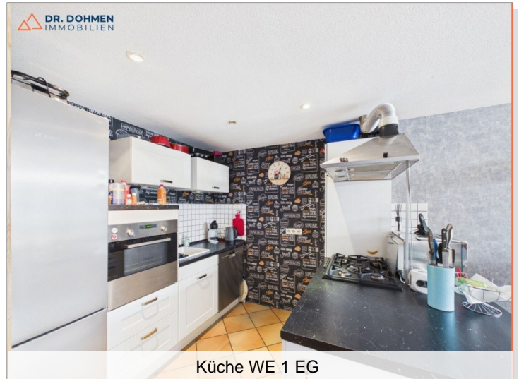
Küche WE 1 EG